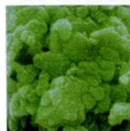
BR-p 3 の20万倍顕微鏡写真

ウイルス飛沫の侵入に対し、マスクが立体的に顔の下半分を包みます。そのとき、顔の形状によっては横に隙間が広くでき、これまで容易に飛沫の侵入を許していました。しかし、(ダブルオメガ)形状の採用により、頬の中央付近を積極的に押さえる力が働き、従来と比較して横からの飛沫の侵入が大幅に減少、より安全性が高まりました。