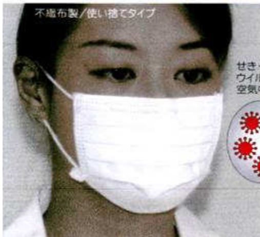
不織布製/使い捨てタイプ